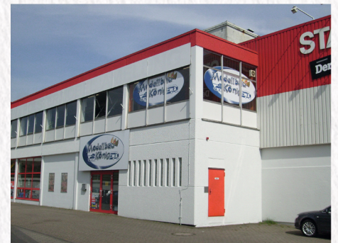
Das Ladengeschäft im Jahre 2008 von außen