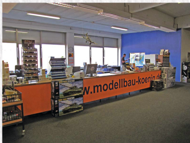
Unser „Büro“ und Tresen im Ladengeschäft

Noch zwei Leute fürs Lager und den Versand (Fakrim ist auch heute noch unsere Hauptkraft am Packtisch) wurden eingestellt und schon konnte es losgehen. Jetzt, mit vergrößertem Sortiment und viel Arbeit jeden Tag, wuchs die Anzahl der Artikel, die wir online anboten, schnell auf 20.000 an.