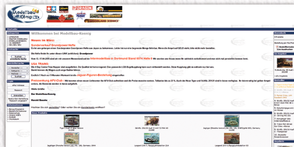
Ein Screenshot aus 2005 – der Shop beinhaltet noch Modellbau UND Eisenbahn

Zu diesem Zeitpunkt belieferte keiner der etablierten Großhändler reine Onlineshops oder Internethändler. Die allgemeine Auffassung war: „Dieses Internet, das ist bald wieder weg.“. Also importierten wir die Bausätze per Luftfracht direkt aus den USA. Dort waren die meisten Neuheiten früher erhältlich, da die Transportwege zwischen Asien und der US-Westküste nur etwa zwei Wochen betragen, wohingegen die Schiffe nach Europa meist fünf oder sechs Wochen unterwegs waren. Daher waren wir damals oftmals die Ersten, die neue Bausätze anbieten konnten.