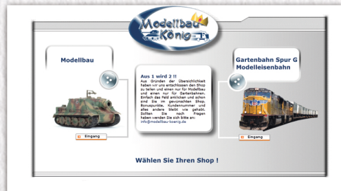
2006 wurde die Startseite des Shops zur Auswahlseite ...

Es begann die große Zeit von Dragon und Trumpeter, die den etablierten Marken damals mit günstigen Projekten und viel Inhalt mächtig einheizten.